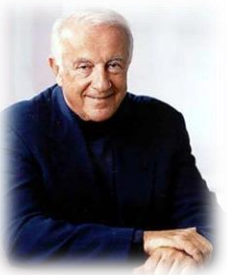
Robert Atkins, MD